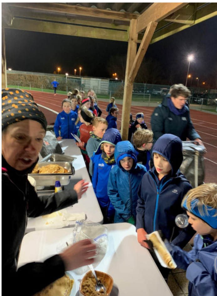
Op dinsdag 07/02/2023 kregen de atleten van AVZK lekkere pannenkoeken.