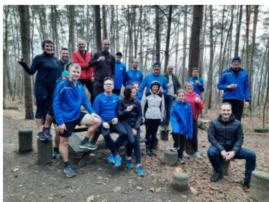
Deze atleten hebben het jaar alvast goed ingezet met hun traditionele training op nieuwjaarsdag in het bos van Begijnendijk